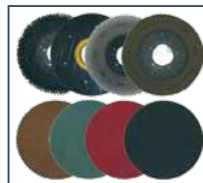
SPAZZOLE, DISCHI TRASCINATORI E ABRASIVI CEPILLOS, DISCOS DE ARRASTRE Y ABRASIVOS BROSSES, PLATEAUX D'ENTRAÎNEMENT ET ABRASIFS