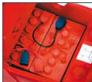
NO.2 BATTERIE 12V-110 Ah (20h)* 2 BATERÍAS 12 V-110 Ah (20h) 2 BATTERIES 12 V-110 Ah (20h)