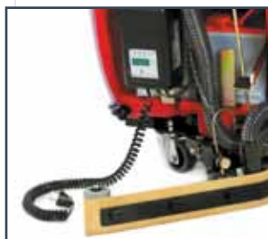
CARICA BATTERIA ON-BOARD CARGADOR DE BATERÍA INCORPORADO CHARGEUR DE BATTERIE EMBARQUÉ